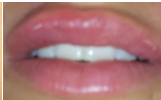
Lippenvergrößerung beim Mann